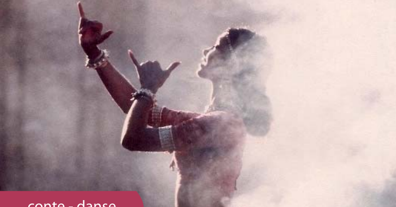
conte - danse