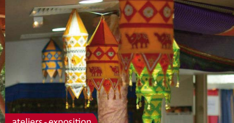
ateliers - exposition

Site Internet : www.la-tertulia-flamenco.over-blog.com